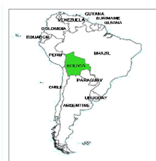
Gráfico 2: Situación geográfica de la República de Bolivia

La República de Bolivia se encuentra casi en el centro de Sudamérica. Limita al norte y al este con Brasil, al sur con Argentina y Paraguay, y al oeste con Chile y Perú. Su territorio comprende parte importante de la Cordillera de los Andes, el Altiplano, la Selva Amazónica y el Gran Chaco, lo que le permite estar categorizado como país megadiverso. Además, es junto con Paraguay, uno de los dos países de América sin litoral marítimo.